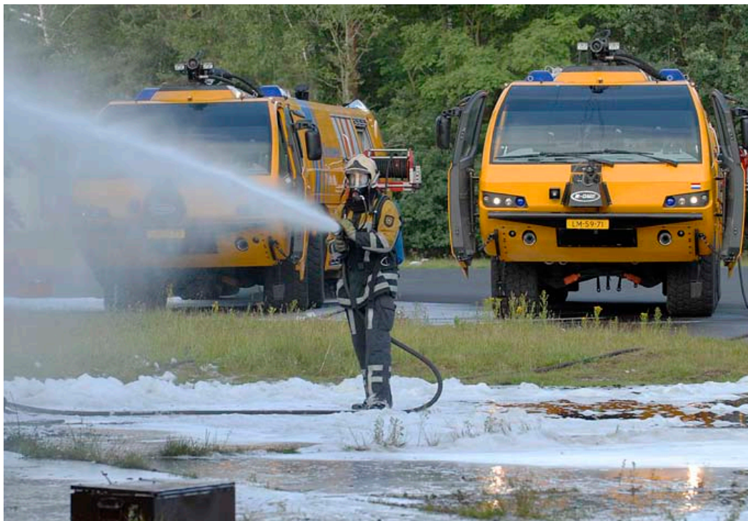
Hulpverleners hadden hun handen vol aan de rampenoefening op de vliegbasis.

In juni was Vliegbasis Soesterberg het toneel