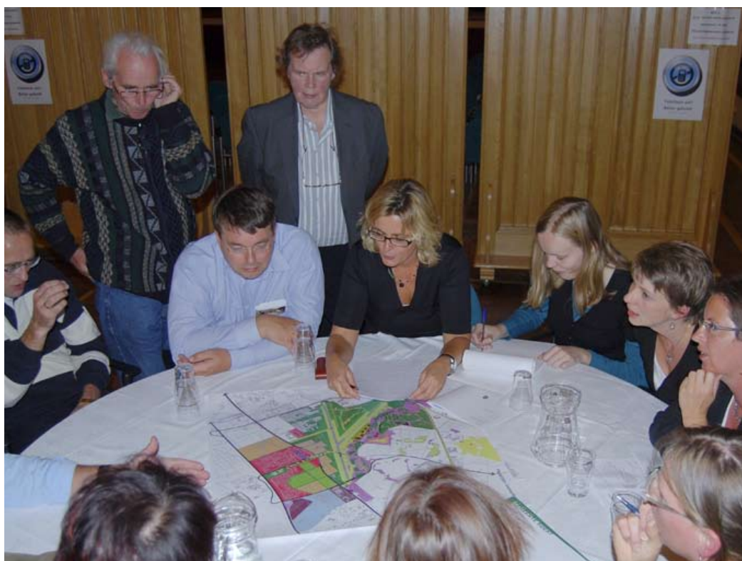
In 2009 wordt het Masterplan afgerond. Dit plan op hoofdlijnen wordt vervolgens uitgewerkt in gedetailleerde uitvoeringsplannen en concrete activiteiten.

“Ontwikkeling betekent voor mij ook het goede behouden en streven naar wat beter kan”, aldus Noordergraaf. “Bij het goede denk ik onder meer aan het groene karakter