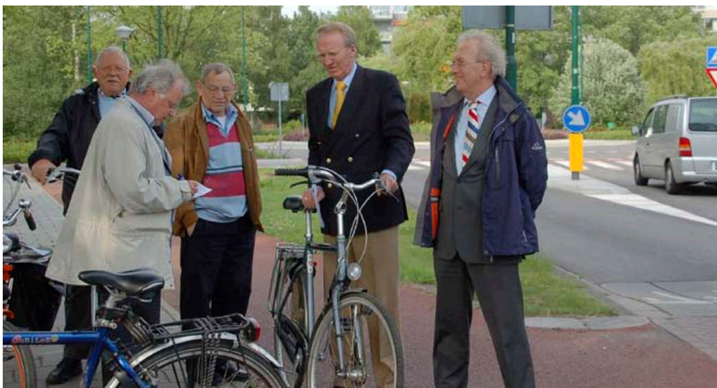
Voorafgaand aan de wijkavonden maken de collegeleden op de fiets een ronde door de wijk.