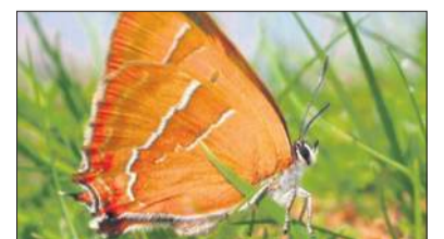
De Engh in Soest (exacte locatie volgt via de mail na aanmelding)