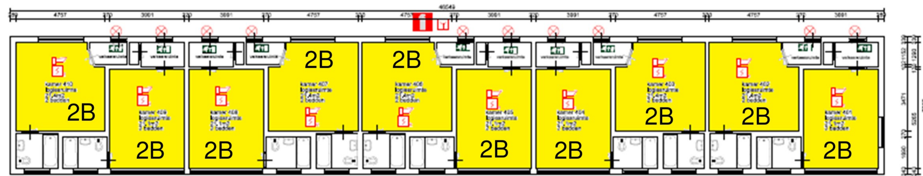
Bijgebouw 3 Technische capaciteit: 20 bedden