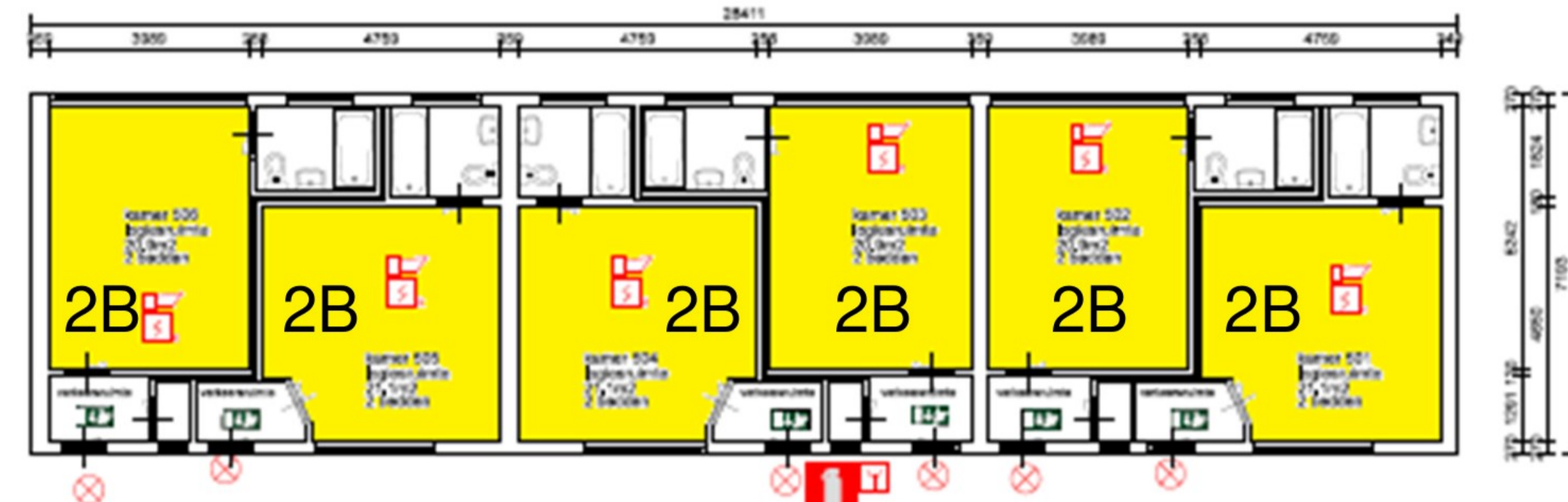
Bijgebouw 2 Technische capaciteit: 12 bedden