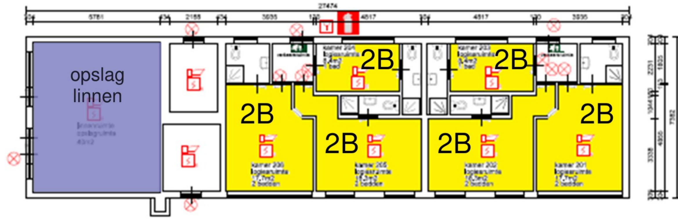
Bijgebouw 1 Technische capaciteit: 12 bedden