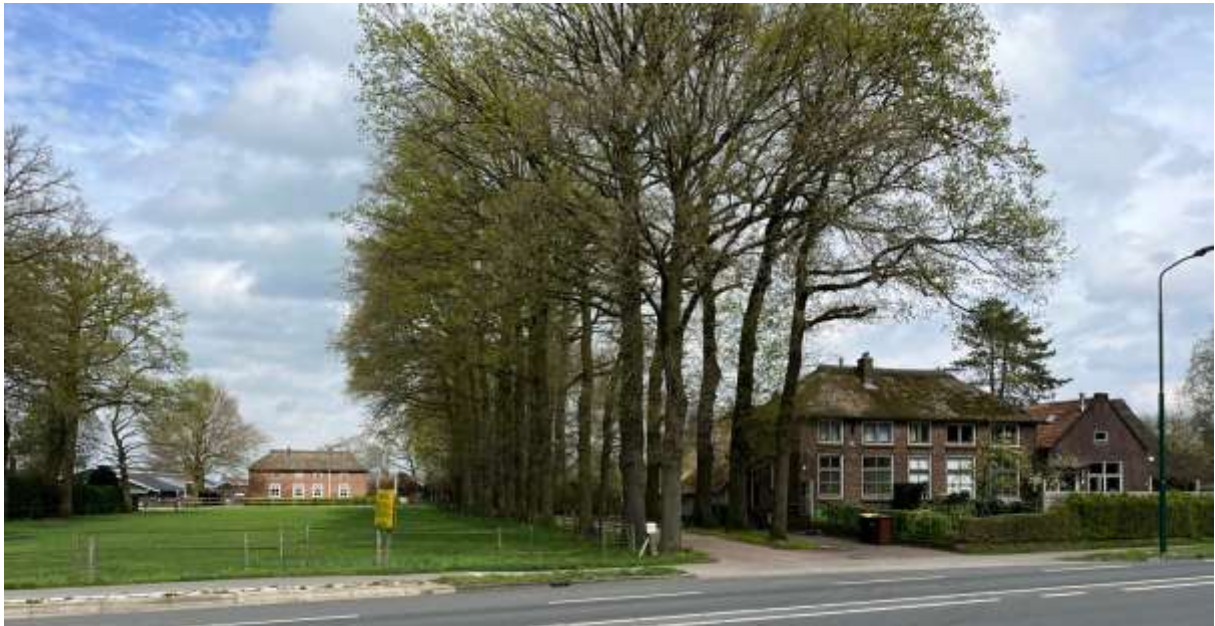
Monumentale oprijlaan ter plaatse van de boerderij Birkstraat 125.