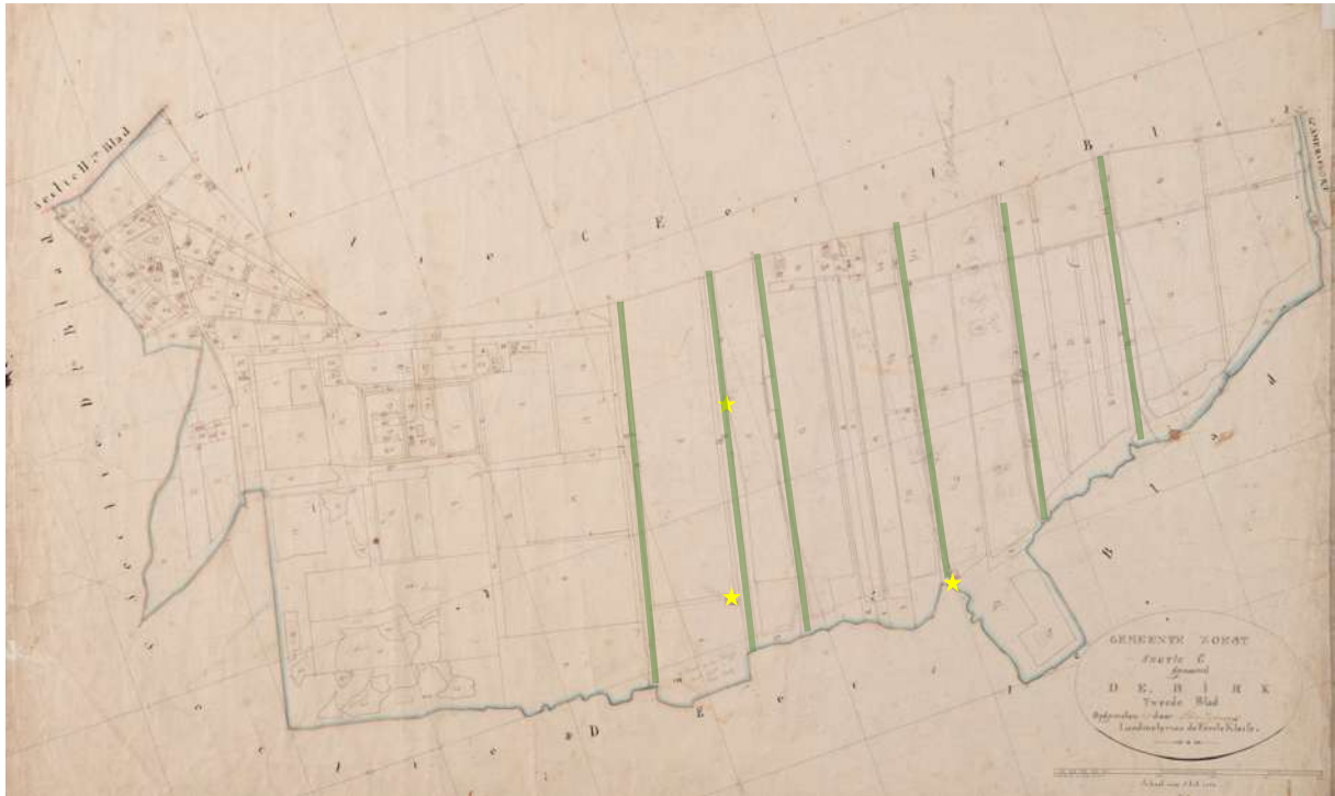
Kadastraal minuutplan 1811-1832, Gemeente Soest, Sectie C1 (onder, gebied ten noorden van de Birkstraat) en C2 (boven, gebied ten noorden van de Birkstraat), Op de kaart zijn de aanwezige schapenstallen met een gele ster gemarkeerd. De landschappelijke structuur, met bospercelen achter op het perceel die zijn verbonden met de lanen naar de Birkstraat, is duidelijk herkenbaar op deze kaart (boven, groene marking).