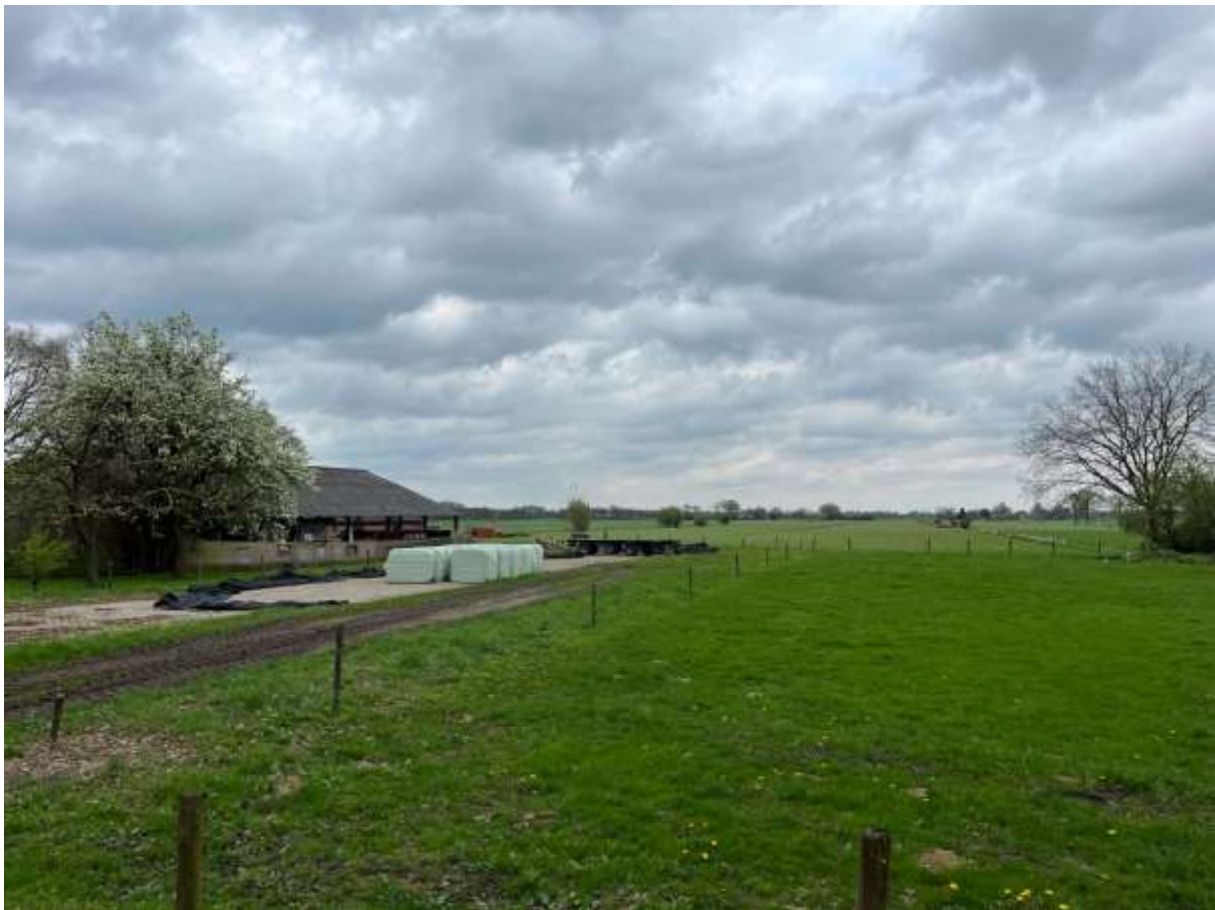
Noordzijde van de Birkstraat, ter hoogte van Birkstraat 109. De diepe doorzichten geven zicht op het open agrarische landschap van de Eemvallei. Links zijn de restanten van een historische (bloeiende) fruitboomgaard te zien.

Binnen de gemeente Soest is naast het buurtschap De Birkt geen andere historische structuur aanwezig, waarin een ensemble van historisch landschappelijke kenmerken en historische bebouwingsstructuur aanwezig is in een aan De Birkt vergelijkbare hoge mate van gaafheid. Hierdoor is de Birkt, met de daarin gelegen landschappelijke structuur en bebouwing, zeldzaam binnen de gemeente Soest