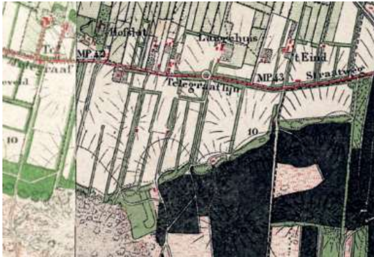
Topografische kaart 1883 (topotijdreis.nl). Het kaartbeeld laat de kenmerkende landschappelijke structuur van de ontginning zien. De percelen worden gescheiden door bosschages, waardoor een gecompartmenteerd halfopen landschap is ontstaan.

Aan de noordzijde van de Birkstraat lagen de boerderijen iets verder verwijderd van de weg. Om de boerderijen te bereiken waren er lanen aangelegd, die door hoog opgaande bomen werden begeleid. Hierdoor zijn monumentale oprijlanen ontstaan naar de historische boerderijen in het gebied.