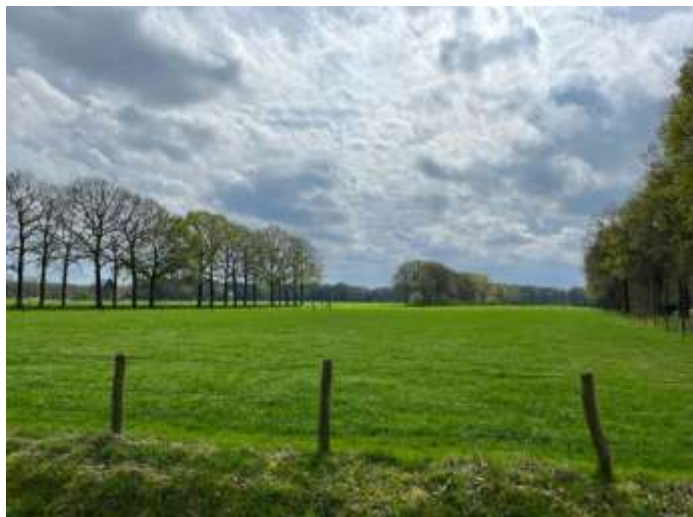
Het landschap rondom de Maarschalkersteeg (foto links) en Hofslottersteeg (foto rechts) laten een duidelijk contrast zien tussen de beschutte stegen met opgaand hout en de openheid van de voormalige akkercomplexen, die eveneens tussen (restanten van) opgaande houtwallen (links op de foto rechtsonder) zijn gelegen. Op de achtergrond zijn de bossen van de hoger gelegen Soesterduinen zichtbaar.