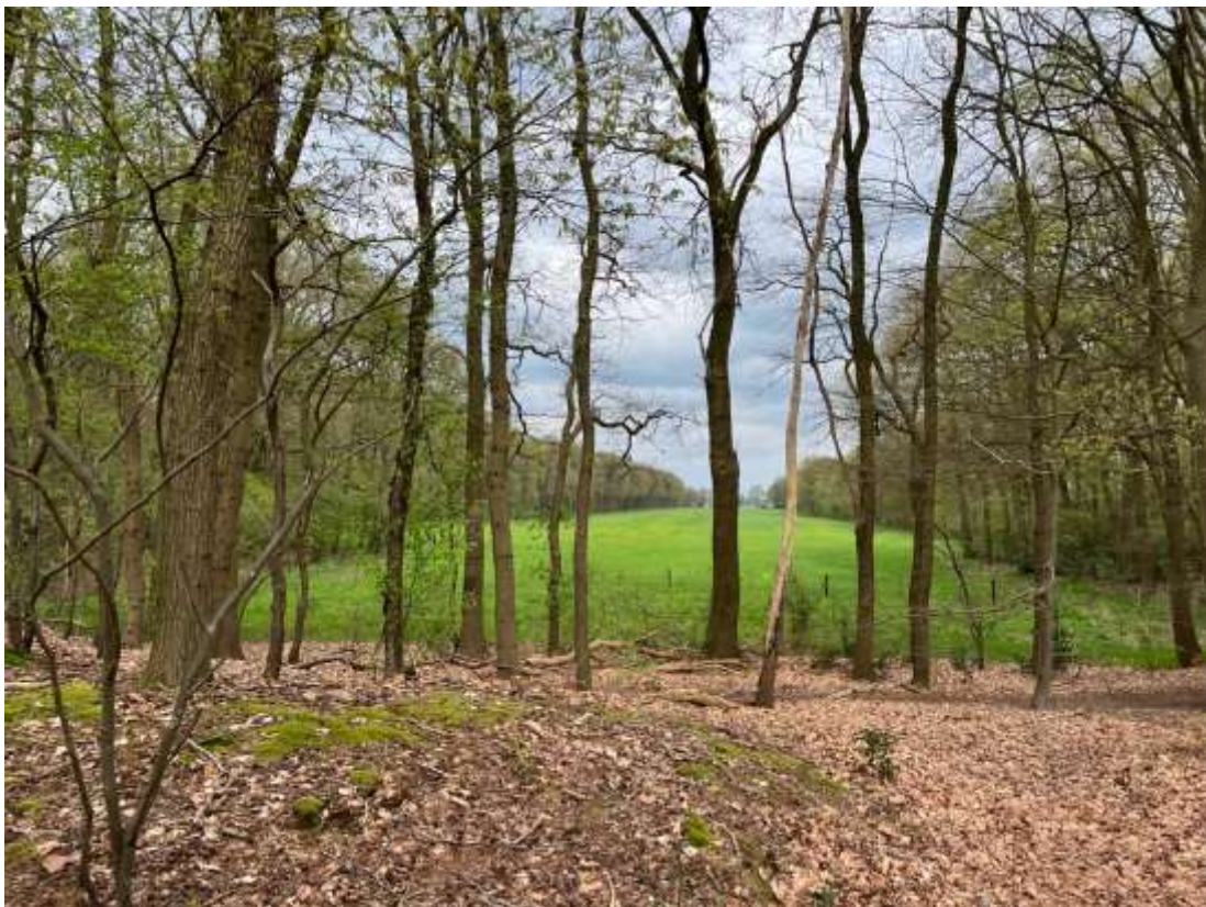
De achterzijde van de percelen van de Hoge Birk (ten zuiden van de Birkstraat bestaan vaak uit bos, net als de houtwallen tussen de percelen. Zicht vanaf de Maarschalkerweg richting de Birkstraat t.h.v. parkeerplaats Korte Duinen.

Wanneer de ontginningen van dit gebied exact hebben plaatsgevonden is niet bekend. Dit zal waarschijnlijk ergens tussen de 11 de en de 15 de eeuw zijn geweest. Het gebied ten zuiden van de Birkstraat is een regelmatige kampontginning met een strokenverkaveling, waarbij sprake is van esvorming (bron: Agrarische landschappenkaart, Ontginningstypen hoog Nederland, Rijksdienst voor het Cultureel Erfgoed (geraadpleegd 30 januari 2024)). De kampontginningen op de zandgronden dateren over het algemeen van rond het jaar 1000. Het waren ontginningen die buiten de dorpsstructuren (in dit geval Soest) werden ontgonnen door een boerderij of een groep van boerderijen. Deze 'kampen' bestonden uit regelmatige langgerekte akkers met wisselende breedte en op de wat hoger gelegen zandige gronden, omzoomd met eiken. Voor het vee werden omwalde en met bomen omzoomde weilanden gerealiseerd. Deze lagen aan de meer natte zijde van de nederzettingen. In dit geval aan de zijde van de Lage Birk (ten noorden van de Birkstraat, richting de Eemvallei). Het achterste deel van de percelen aan de zuidzijde van de Birkstraat waren doorgaans het droogste en minst vruchtbare. Deze waren vaak beplant met een klein bosperceel. De regelmaat van de structuur impliceert een zekere planmatigheid.