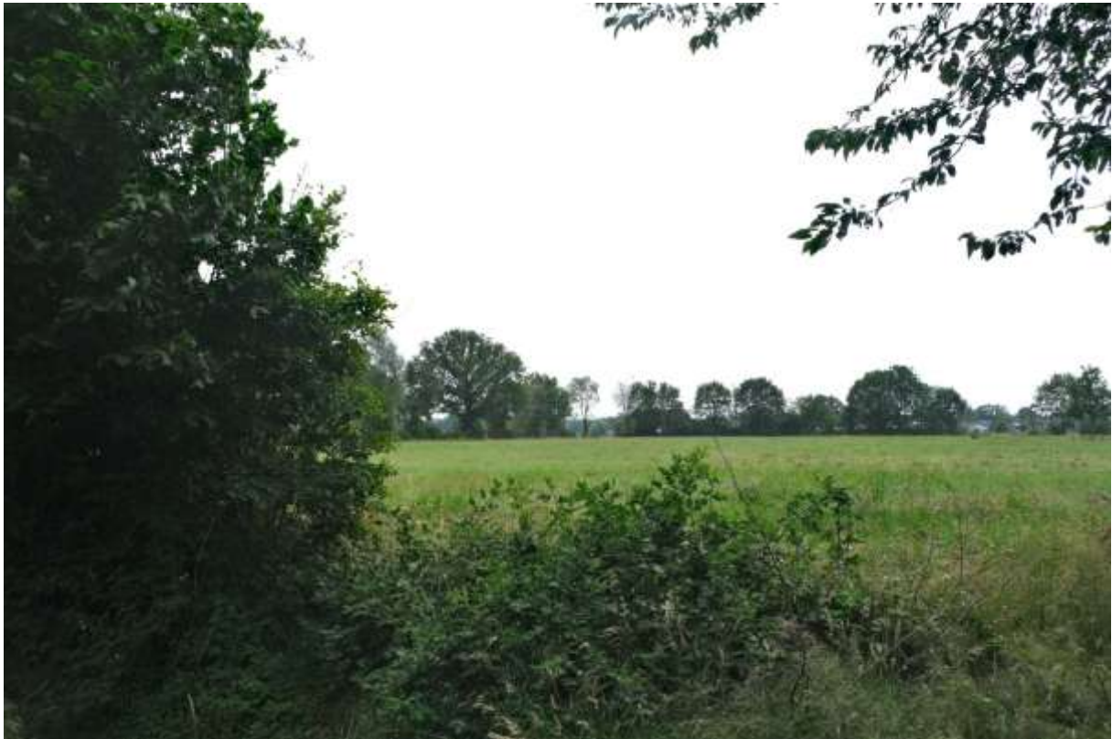
Het gebied herbergt kleinschalige weides.

Aan de oostzijde van de Ferdinand Huycklaan staan nog enkele agrarische gebouwen die een visuele en van oorsprong functionele relatie hebben met het achterliggende agrarische landschap. De agrarische bebouwing aan de oostzijde van de laan heeft daarom een hoge waardering. De waardering van de bebouwing binnen het omschreven gebied zegt niets over de individuele waarden van de gebouwen. Die zijn in deze afweging niet meegenomen.