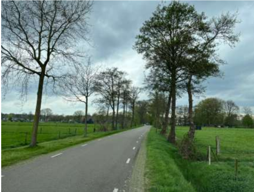
Boven – De Peter van den Breemerweg is binnen het beschreven gebied voorzien van beplanting aan twee zijden van de weg.

bebouwing in het gebied iets toe, maar de dichtheid blijft zeer laag en alle bebouwing betreft van oorsprong agrarische bebouwing met bijbehorende erven en boomgaarden.