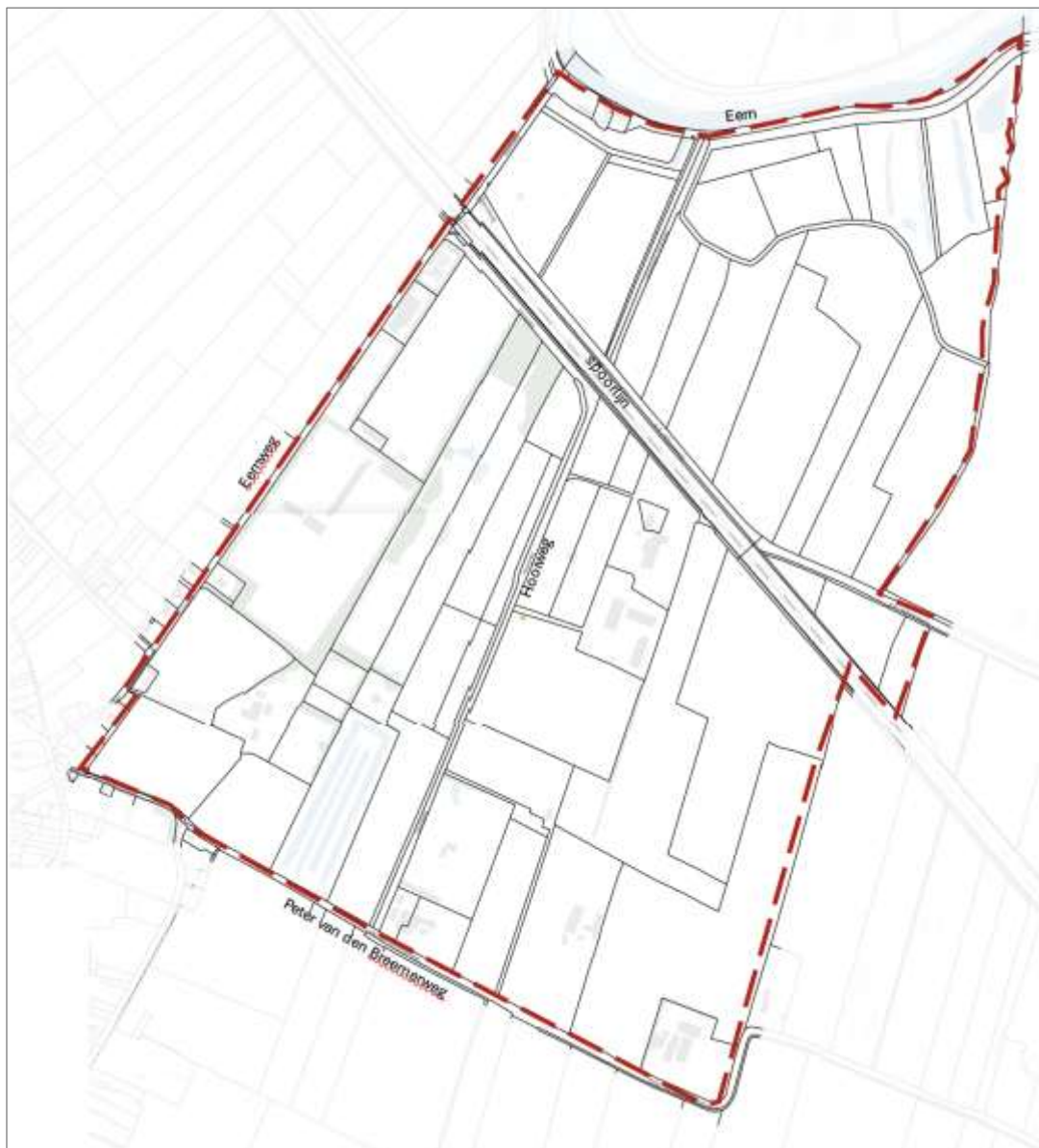
Begrenzingskaart Blokverkaveling tussen Eem en Peter van den Breemerweg.