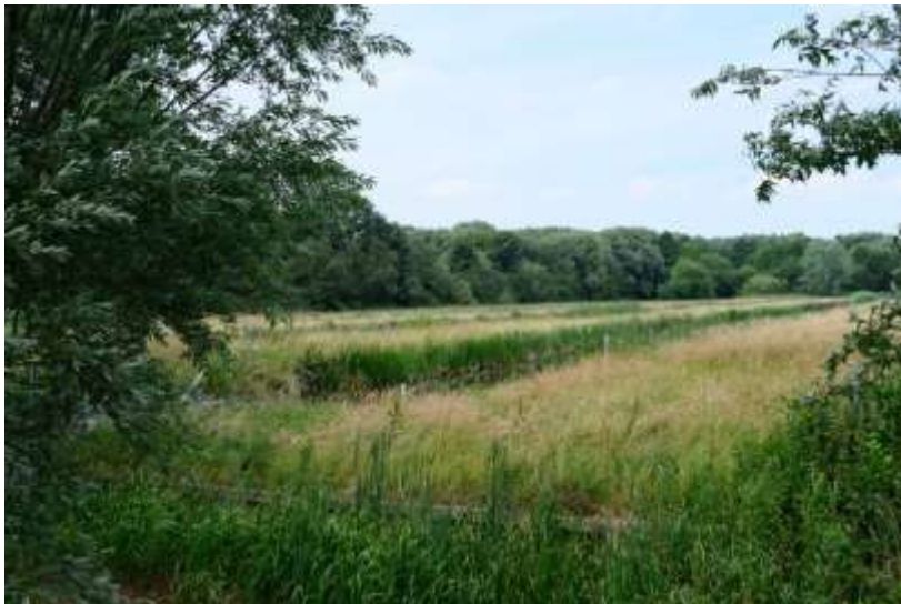
Het Biezenveld (Helofytenfilter) heeft een eigen karakter met veel riet.