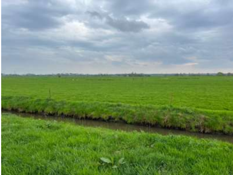
Het open polderlandschap gezien vanaf Het Jaagpad richting het spoor. Op de voorgrond een restant van een van de twee veenriviertjes. Hoewel deze nog wel gebogen in het landschap ligt, doet het uiterlijk verder meer denken aan een kavelsloot.