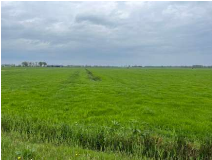
Onder – Vanaf de noordzijde van het spoor kijkend richting de Eem is er sprake van een overwegend leeg weidelandschap.