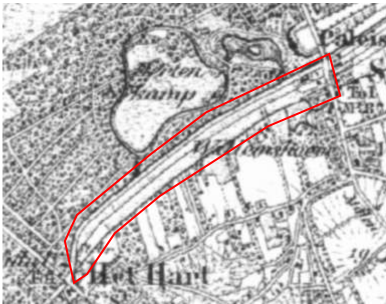
Topografische militaire kaart 1850 (topotijdreis.nl). Op de kaart is de ligging van het Dal van het Grachtje goed waarneembaar als gevolg van de afwijkende perceelsrichting van het gebied en de afwezigheid van beboste terreinen.

Op de topografische kaartbeelden lijkt er daarnaast sprake te zijn van weinig verkavelde percelen. Een detail van een van de luchtfoto's, die genomen zijn door de RAF aan het einde van WOII, laat zien dat er voor het aanleggen van de Jachtlaan wel sprake was van percelering in het gebied in de vorm van sloten. Wat hierop ook zichtbaar is, is dat het gebied onderdeel is geworden van het agrarische areaal van de boerderijen in de Soester Akkeren. De slagschaduw op de foto toont aan dat er langs de perceelsranden bij sloten, die evenwijdig aan de oriëntatie van het gebied liggen, lage struiken en bomen aanwezig zijn.