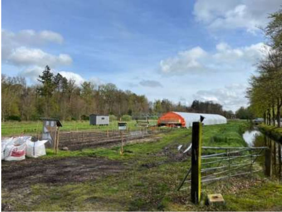
Tuinderij met een tijdelijk karakter in het gebied van het Dal van het Oude Grachtje.

Een luchtfoto uit 2023 geeft inzicht in de huidige percelering van het gebied. In de afgelopen 70 jaar is de lange tussensloot die evenwijdig aan de zuidwest-noordoost-oriëntatie liep, gedempt. Alleen haaks op die oriëntatie staande sloten zijn behouden gebleven, waarbij er langs enkele van deze sloten houtwalleetjes zijn gerealiseerd. Aan de zijde van de Jachthuislaan zijn op de randen van de percelen en bij de dammen over de sloot ter plaatse van het Oude Grachtje ook lage bomen (struweel) geplant, die inmiddels een zekere mate van ouderdom hebben. Het open karakter is daarnaast behouden gebleven. Het gebied wordt nog steeds hoofdzakelijk gebruikt voor agrarische doeleinden (wei- en hooilanden). Daarnaast is in de afgelopen jaren een kleinschalige tuinderij in het gebied ontwikkeld met een tot op heden tijdelijk karakter.