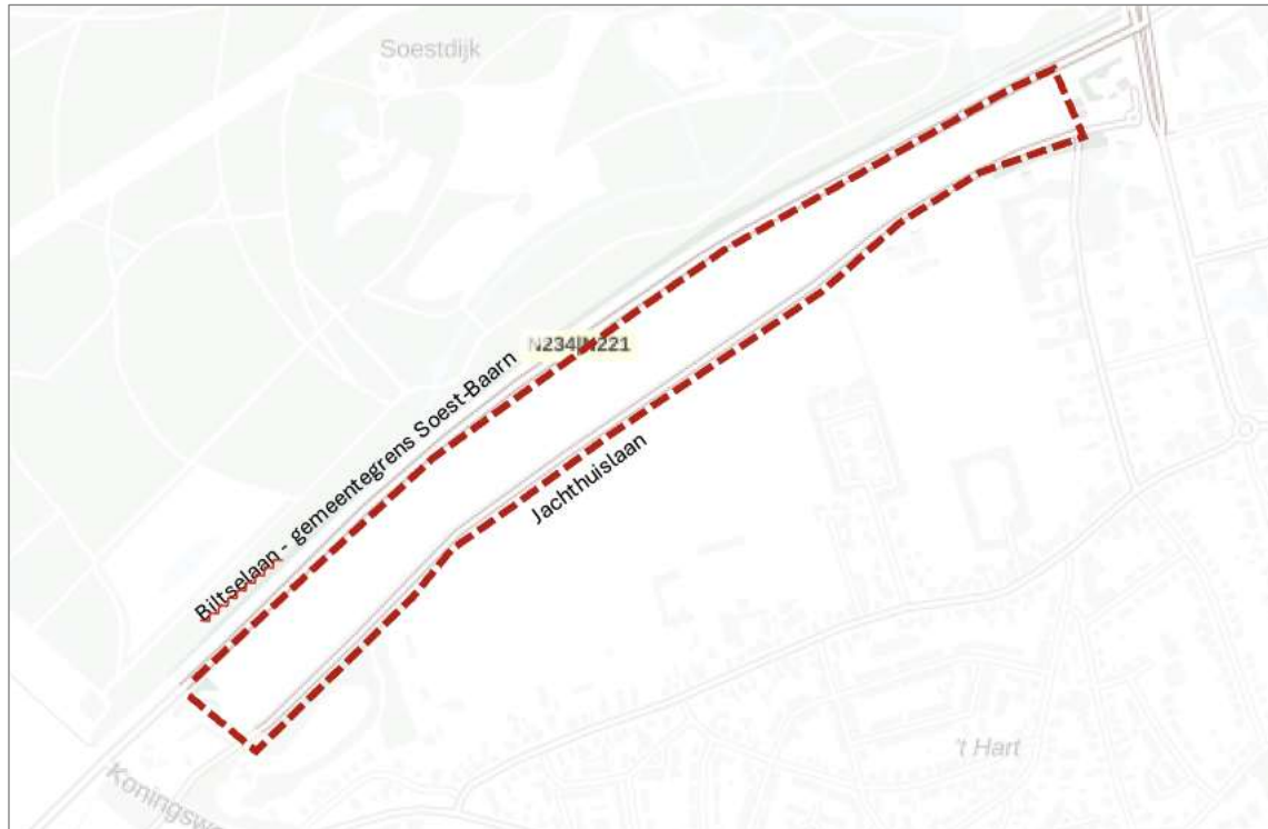
Begrenzingskaart van het Dal van het Oude Grachtje