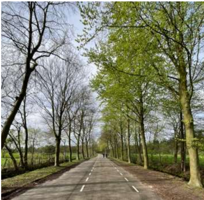
De in de jaren 70 aangelegde Jachthuislaan is voorzien van bomenrijen, waardoor deze een landelijke en monumentale uitstraling heeft gekregen als nieuwe toevoeging in het Dal van het Oude Grachtje.

De aanleg van de Jachthuislaan in de jaren 70 heeft een brede laan aan het gebied toegevoegd, die met zijn zware laanbeplanting een landelijke en historische uitstraling heeft. Deze doet als secundaire infrastructuur dienst, naast de Biltseweg die vooral voor snel verkeer is bedoeld.