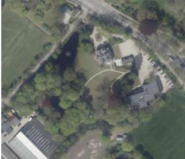
De huidige toestand anno 2023. Op het terrein overheerst een restant van het park met bomen, slingerpaden, open gazons en een vijver. Dit vormt een ensemble met het historische hoofdhuis.