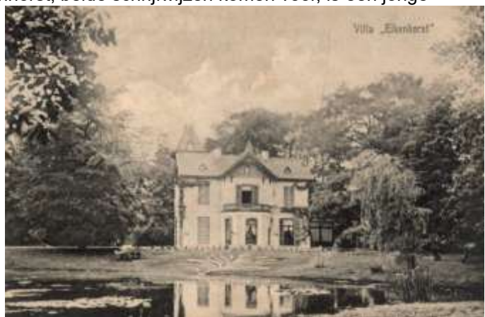
Westzijde van Villa Eikenhorst aan het begin van de 19 e eeuw.