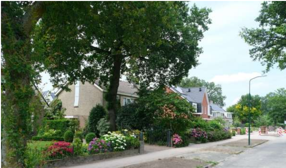
Bebouwing aan de westzijde van de Ferdinand Huycklaan

van ontstaan van deze bebouwing. Vanwege de ligging kort bij de Eng en vanwege de aanwezigheid van een brink, is het vermoeden dat de basis van de bebouwing Middeleeuws zal zijn. In de loop van de 19de en 20ste eeuw neemt de bebouwingsdichtheid in beperkte mate toe. Daarnaast worden de oudere boerderijen vervangen door nieuwe bebouwing. Van oorsprong had de bebouwing een agrarisch karakter en was er een relatie met de akkers op de Soester Eng en het aan de oostzijde gelegen ontginningsblok. Inmiddels bestaat de bebouwing langs de westzijde van de Ferdinand Huycklaan overwegend uit vrijstaande burgerwoningen, waardoor de relatie tussen de Ferdinand Huycklaan en de Soester Eng zo goed als verdwenen is. Aan de oostzijde van de Ferdinand Huycklaan staat nog een enkele boerderij, die de relatie tussen de oostelijk daarvan gelegen agrarische landerijen levend houdt. De bebouwing is overwegend kleinschalig en sober van karakter.