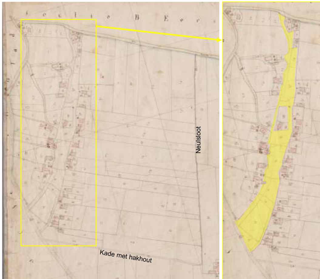
Detail kadastrale minuut 1832 Sectie C, 2 e blad (Collectie Rijksdienst voor het Cultureel Erfgoed) en uitsnede. De geel gemarkeerde percelen op de uitsnede waren in gemeenschappelijk eigendom, de eigenlijke brink.

van de Korteindse brink (bron: Derks en Heurneman 2010, p.21). Het betreft een situatie die ook nog steeds te zien is op de kadastrale minuut.