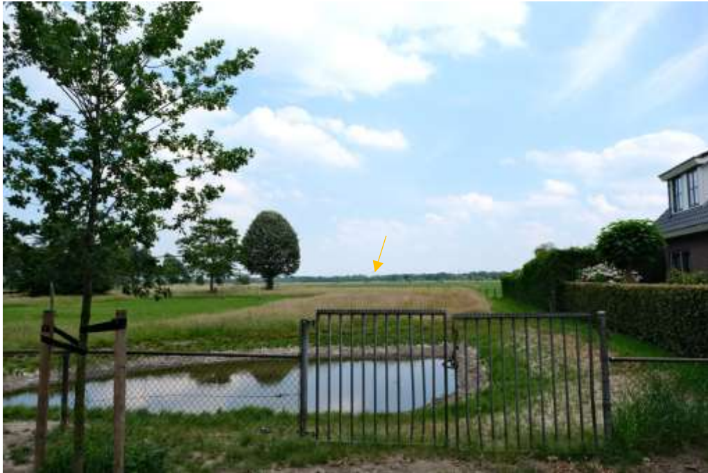
Aan de oostzijde is de relatie met het agrarisch landschap groot. Er is zicht op de kerktoeren van Amersfoort (gele pijl).

N.B. De overige delen van de engrandontginningen, aan de noord- en de zuidzijde van de Soester Eng vallen inmiddels volledig binnen de bebouwde kom. Voor de ruimtelijke kwaliteit van deze delen en de bijbehorende waardering wordt verwezen naar de waardering van de wijken Soest-Midden en Smitsveen in het rapport van Leon Sebregts, Cultuurhistorische verkenning en waardestelling Stedenbouw en bouwkunst gemeente Soest, Utrecht.