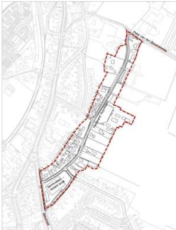
Begrenzingskaart omschreven gebied

Datering: Mogelijk reeds vanaf de 8 ste en 9 de eeuw na Chr.