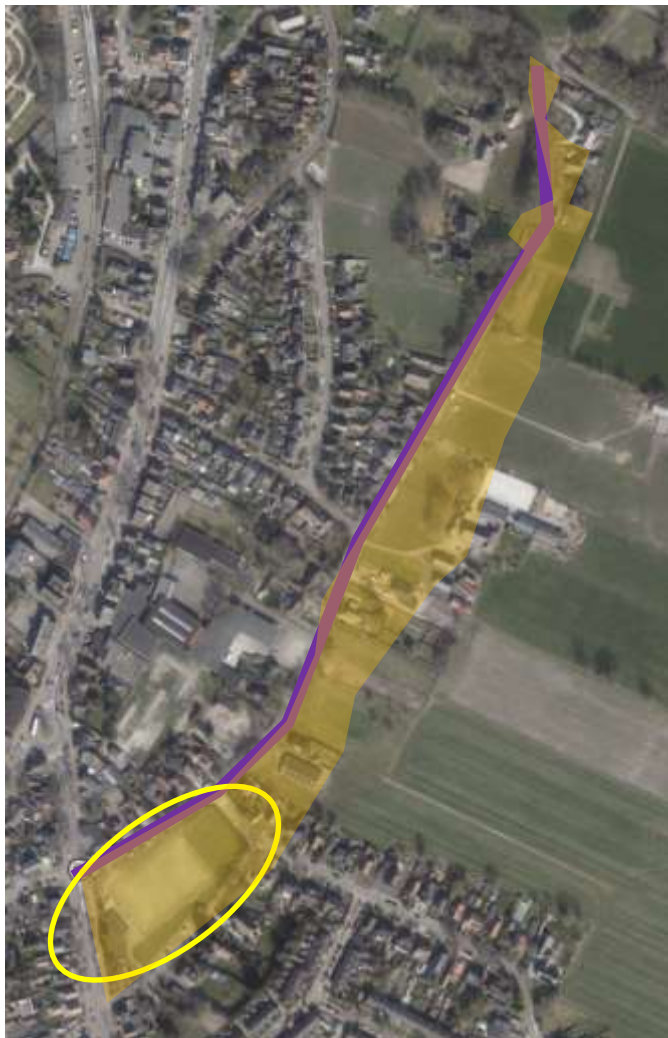
Luchtfoto van de Ferdinand Huycklaan anno 2022 (topotijdreis.nl). De zuidelijke punt van de Korteindse brink is in gebruik als sportterrein (geel gemarkeerd). De loop van de Ferdinand Huycklaan (paars gemarkeerd) is sinds het begin van de 19 de eeuw ongewijzigd gebleven. Het oranje transparante vlak geeft de vorm en de positie van de brink weer, zoals deze op de kadastrale minuut 1832 is ingetekend. Het agrarisch landschap grenst hier direct aan de Ferdinand Huycklaan.

Hoewel de gronden van de brink niet langer gemeenschappelijk bezit zijn, blijft het grootste deel van het gebiedje onbebouwd en wordt onderdeel van het open agrarische landschap ten oosten van de Ferdinand Huycklaan en grenst hier ook direct aan. Dit is zo tot op de dag van vandaag. Er heeft slechts in zeer beperkte mate verdichting van de bebouwing aan deze zijde van de kern van Soest plaatsgevonden. De zuidelijke punt van de Korteindse brink is wel verder ontwikkeld, maar doet vanaf halverwege de jaren 80 dienst als sportterrein. De sportvelden die hier vandaag de dag liggen, hebben het open karakter van de brink weten te behouden, ondanks dat de functie gewijzigd is.