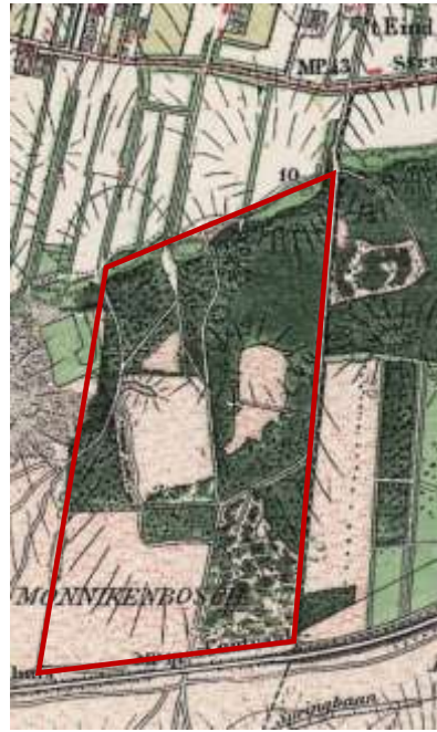
Links - Detail van de topografische militaire kaart 1850 (topotijdreis.nl). Het Monnikenbos bevindt zich in het gebied helemaal in het zuidelijke puntje van het omschreven gebied. In deze periode is het geheel bebost. Rechts - In 1900 ziet het gebied er heel anders uit (topografische kaart 1900, topotijdreis.nl). De bebossing ten noorden van het gebied aangeduid met de naam Monnikenbos is nu grotendeels voorzien van bos, terwijl het eigenlijke Monnikenbos nu grotendeels ontbost is.