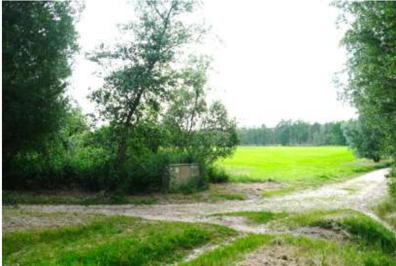
Het hoogteverschil tussen de oude zandafgraving (het oorspronkelijke Monnickenbos) is in werkelijkheid goed te ervaren. Op de foto's verdwijnt de zichtbaarheid ervan)

ook regelmatig veranderd, maar heeft vermoedelijk wel altijd als een agrarisch gebied (bosbouw/ begrazing door schapen/ akkerland gediend). Tegenwoordig heeft het gebied vooral natuur- en recreatiewaarden. In het gebied komen verschillende soorten bomen voor. Er zijn delen die voornamelijk uit dennen bestaan en delen die een meer gevarieerd beeld vertonen met eiken, beuken en berken. Daartussen liggen enkele heidegebiedjes en een akker in de zandafgraving.