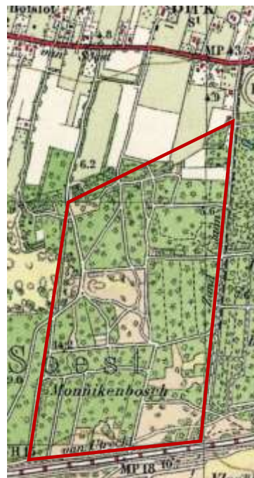
Links - Detail van de topografische militaire kaart 1925 (topotijdreis.nl). Het eigenlijke Monnikenbos en het gebied daarboven zijn weer bijna geheel tot bos verworven. Rechts - Detail van de topografische militaire kaart 1950 (topotijdreis.nl). Terwijl in het hart van het gebied een open ruimte is ontstaan, is de rest van het gebied bijna geheel dichtgegroeid. Het aantal paden door het gebied is ook toegenomen.

Het gebiedje is naar verwachting in gebruik als productiebos. De aanleiding om dit te denken, is de snelheid waarmee de omvang van het bosgebied door de tijd heen verandert in heide/ zandverstuiving en dan weer bos. In 1950 is bijna het gehele gebied in gebruik als bos. Er liggen slechts enkele open plekken in het gebied. Daarnaast is sinds de kadastrale minuutkaart uit 1832 het aantal paden in het gebied snel toegenomen. Van de schaapskooi is dan ook al lange tijd geen spoor meer te bekennen in het kaartbeeld.