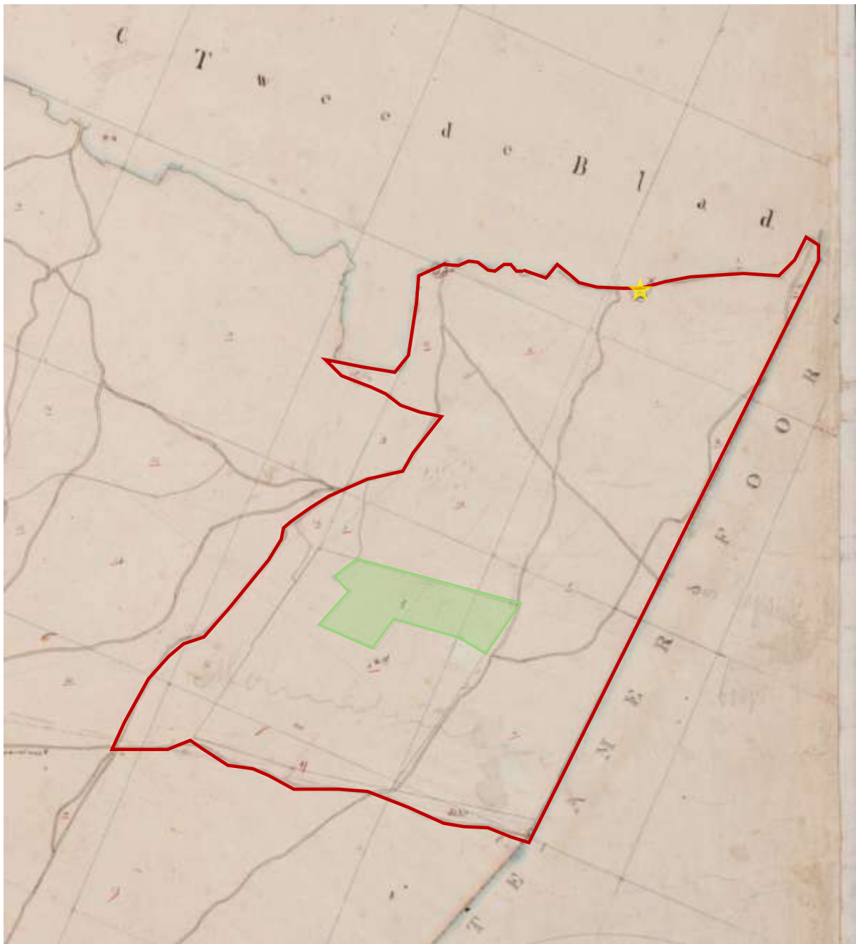
Detail Kadastrale minuutkaart 1832, Sectie D, eerste blad (Collectie Rijksdienst voor het Cultureel Erfgoed). Het gebied bestaat overwegend uit heidevelden, een enkel gebiedje met zandheuvelds en in het hart (groen gemarkeerd) ligt een dennenbosje. De naam Monnikenbos is met potlood in de kaart ingetekend. Een schaapskooi ligt aan de noordzijde van de kaart (gele ster).