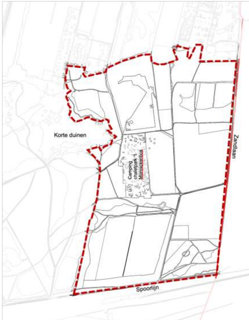
Begrenzing omschreven gebied