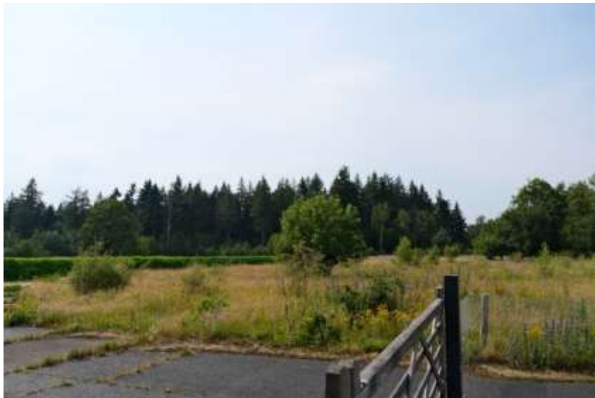
Onder - Op de velden staan solitaire loofbomen en daarachter zijn gemengde bossen met meer dennenbomen zichtbaar in deelgebied A.