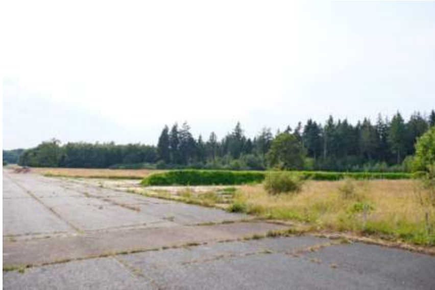
Boven – Deelgebied A is niet vrij toegankelijk. Het bestaat gedeeltelijk uit velden en gemengde bossen.