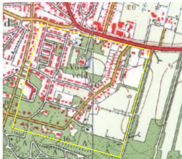
Links – Rond 1940 hebben zich er al grote veranderingen voorgedaan rondom Vosseveld. Over het voormalige landgoed zijn wegen aangelegd ten behoeve van de bouw van villa's, waardoor het agrarische karakter langzaam verloren gaat.