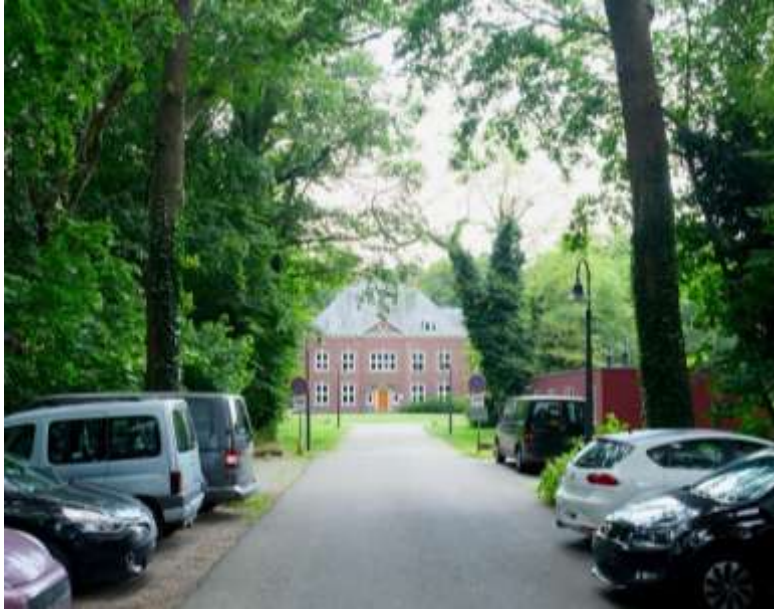
Oprijlaan Vosseveld gezien vanaf de Birkstraat en vanaf het hoofdhuis. De laan is in gebruik als parkeerplaats, hetgeen de monumentaliteit van de laan aantast.