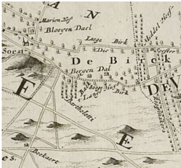
Detail van de Nieuwe Kaart van Utrecht. Links bovenin de dorpskern van Soest en in het midden van de kaart een verwijzing naar de naam Bartholotti. De buitenplaats draagt hier de naam Berg en Dal, wat vermoedelijke een fout is.

Over de omvang het huis zijn slechts beperkte gegevens bekend. Uit de inventaris van Bartholotti uit 1664 is bekend dat de buitenplaats bestond uit een boerderij met schuren, stal en een poortgebouwtje. Het huis van de Bartholotti's zelf was bescheiden van omvang en omvatte niet meer dan een kelder of souterrain, een begane grond met portaal en twee kamers en een zolder met zes