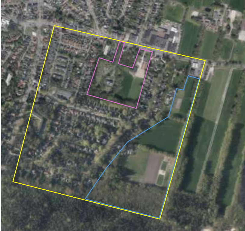
Detail van de luchtfoto anno 2023 (topotijdreis.nl). In de huidige situatie is de voormalige buitenplaats Heuvel en Dael en het latere Vosseveld nog steeds enigszins herkenbaar in de stedenbouwkundige opzet van de wijk Soest-Zuid. Het geel gemarkeerde gebied is de voormalige buitenplaats. De roze markering geeft de plek van het herenhuis en de boerderij Vosseveld aan. Het blauwe gebied betreft het oostelijke gebied dat bestaat uit weiland met houtwallen en bos.

In 1960 werd op het terrein van Vosseveld een houten noodschool gebouwd. Deze zou later uitgroeien tot de Prof. Fritz Redlschool, een school voor langdurig zieke kinderen. Aan het einde van de jaren 60 wordt Vosseveld gekocht door het toenmalige Stads- en Academisch Ziekenhuis Utrecht (het huidige Utrechts Medisch Centrum). Zij vestigden er een centrum voor jeugd- en kinderspsychiatrie. Een functie die het terrein tot op de dag van vandaag heeft.