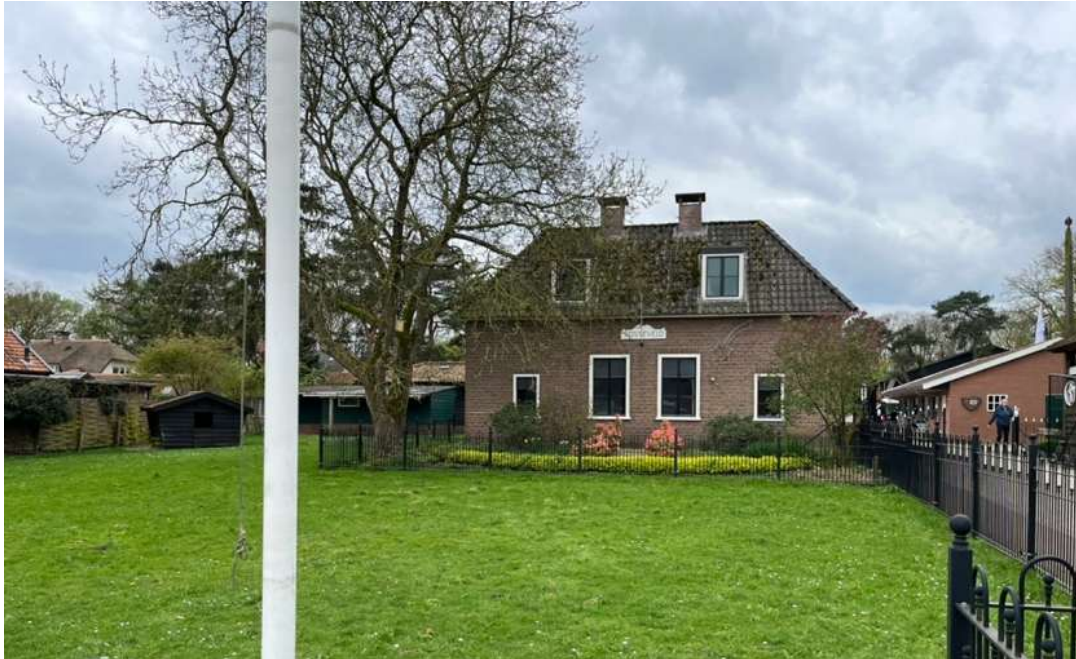
De boerderij Vosseveld ligt op enige afstand van de Birkstraat. Voor het pand ligt een weide.