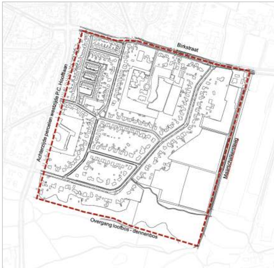
Begrenzingskaart gebiedsomschrijving Vosseveld.