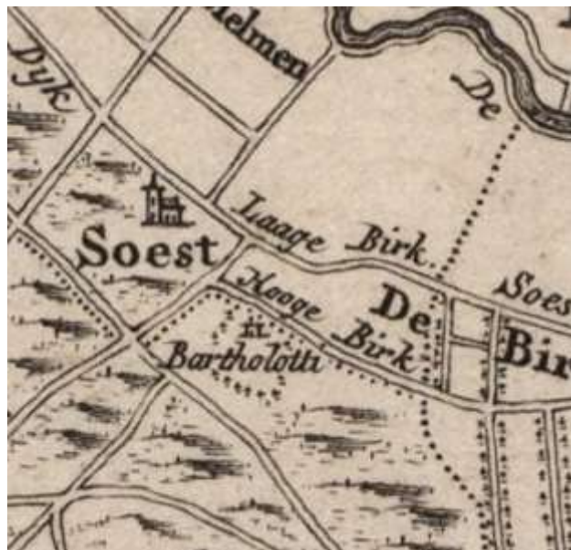
Rechts - Detail van de kaart van Isaak Tirion, ca. 1740. De buitenplaats is op de kaart opgenomen onder de naam Bartholotti.

betimmerde kamertjes. Er waren verder een pachter die voor een kleine veestapel zorgde en een tuinman, wonend in het poortgebouw, die zorgde voor de sinaasappel-, citroen-, en granaatappelboompjes, de gele jasmijn, de palmolijf en de rozemarijn (bron: Artikel P.J. den Breemer nr. 1 - 1992, hvsoest.nl). Vijf jaar later komt neef Constantijn Huygens op bezoek en maakt een wandeling door de tuinen, parken en dreven van de buitenplaats. De parkaanleg had ondanks de worsteling met het stuifzand enkele jaren na de stichting dus toch al vorm kunnen krijgen.