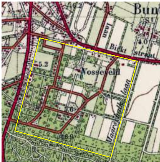
Rechts – Rond 1900 is er nog weinig veranderd aan het beeld van Vosseveld.