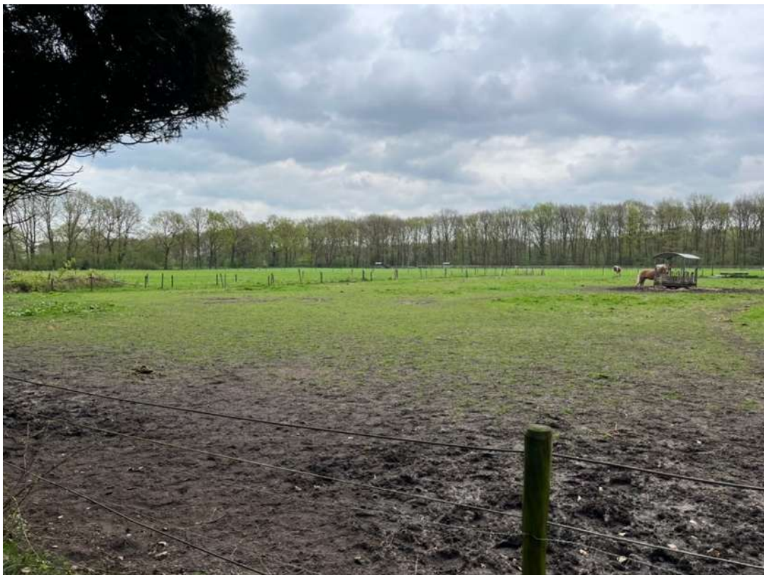
Het onbebouwde, oostelijke deel van de voormalige buitenplaats Heuvel en Dael en voormalig Vosseveld kenmerkt zich door open weilanden, die worden begrensd door houtwallen. Hier gezien vanaf de Maarschalkersteeg richting de Bartolottilaan.